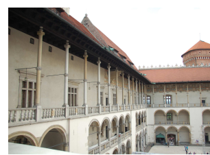
Wawel Hill - Royal Castle Wawel - Zamek Królewski

WYCIECZKI z zawodowymi przewodnikami dla szachistów i osób towarzyszących http://www.przewodnik-krakow.pl/