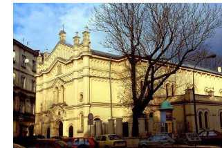
Krakow - Jewish District Kazimierz - Synagoga Tempel

WYCIECZKI z zawodowymi przewodnikami dla szachistów i osób towarzyszących http://www.przewodnik-krakow.pl/