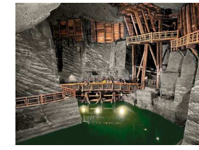
Wieliczka Salt Mine Wieliczka Kopalnia Soli